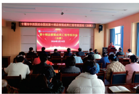
品管圈汇报决赛现场，各团队展示汇报成果。

奖、二等奖、三等奖和优秀奖。 汇报结束，曾院长进行点评指导。他对本次活动的成功举办以及各团队所取得的成绩给予了充分肯定，他指出，品管圈作为全员参与质量管理的重要载体，是我院持续提升医疗质量、打造优质服务品牌的重要举措。针对下一步活动，他提出了三点建议：其一，要扩面提质，全员参与，将成本管控和运营增效融入品管圈工作，