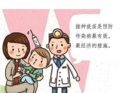
接种疫苗是预防传染病最有效、最经济的措施。

接种新冠疫苗是预防传染病最有效、最经济的措施。接种新冠疫苗是预防传染病最有效、最经济的措施。接种新冠疫苗是预防传染病最有效、最经济的措施。