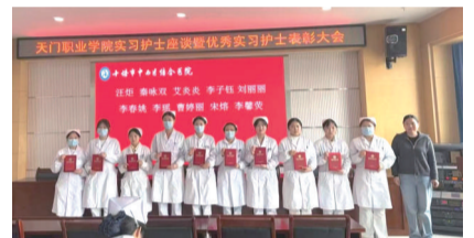
优秀实习生表彰大会，表彰表现优异的实习生。

学管理体系，提高带教质量，为培养更多高素质护理人才、推动护理事业高质量发展贡献力量。 大会在热烈的掌声中圆满落幕。与会领导表示，将继续深化与天门职业学院的合作，共同提升护理人才培养质量，为健康中国建设贡献更多力量。