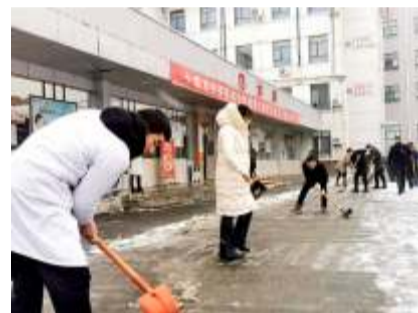
活动中,尽管头顶风雪,大家仍不畏严寒,发扬不怕吃苦精神,挥舞着铁锹对医院内主干道和医院门前

2月2日,我市下起了大雪,皑皑的白雪很快将整个城市妆成了银装素裹的世界,道路明显积雪,特别是医院大门前的通道和医院主干道,给市民出行带来了不便。为方便通行,保障医院正常就医秩序,医院及时组织党员干部、志愿者队伍和保安、保洁人员主动参与到铲雪清扫的义务劳动中。