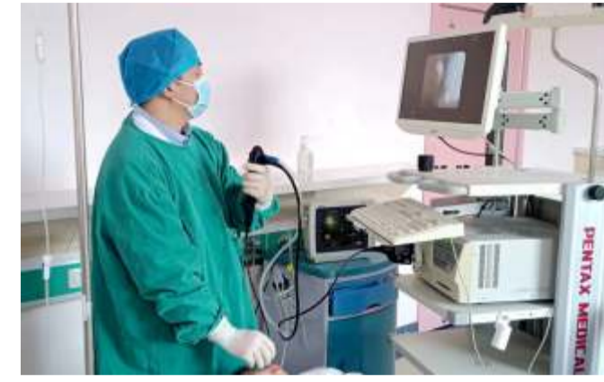
答案: 宝宝肺里“长树枝”原来是“塑性性支气管炎”惹的祸。术后,

返回医院加班为患儿行支气管镜检查。在术中发现患儿肺部炎症感染部位被巨大痰栓几乎完全堵塞, 医护团队密切配合给予加压灌注、负压吸引、钳取, 成功将大片支气管树样的痰栓取出, 直至支气管镜下重见通畅的小气道。至此, 男童的反复高热和难以吸收的大片肺炎终于得到