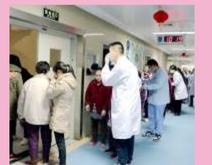
被安全疏散,“火情”被成功扑灭。

在接下来的讲解和演练中,大家按照应急处置人员分工,报警、灭火和疏散同步有效进行,在大家的协同作战下,人员