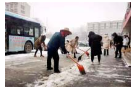
员志愿者的风采,为医院推进“安全生产”,更好的服务群众健康贡献力量。

活动结束后,大家从劳动中体会到了团队的重要性以及奉献的快乐,此次活动展现了医院每一位党